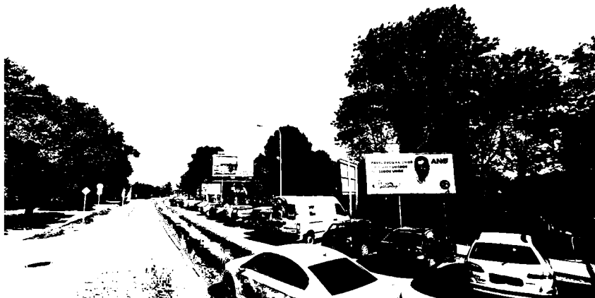
Reklamní zařízení č. 4: Parcelní číslo 313 II. v katastrálním území Praha 19 Kbely (GPS souřadnice 50.144173, 14.579969)